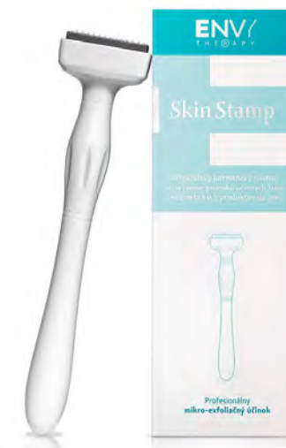
ENVY Therapy® Skin Stamp

Aký je rozdiel medzi MezoStamp a Skin Stamp?