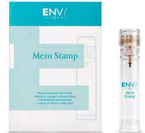
ENVY Therapy® Mezo Stamp