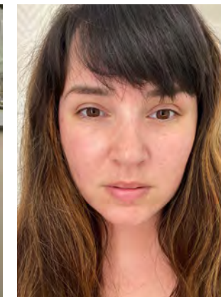
PO október 2020

„Aktuálne som bola aj súčasťou štúdie Pleť ako dôkaz 2021, ktorá má reflektovať účinky a funkčnosť produktov ENVY Therapy® na skutočných ženách a mužoch. Jednoznačne môžem povedať, že moja pleť je toho dôkazom.“